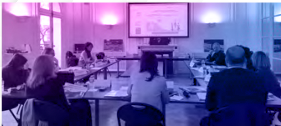
Réunion de délibération du deuxième Jury

RÉDACTRICE EN CHEF ADJOINTE DE LIVRES HEBDO