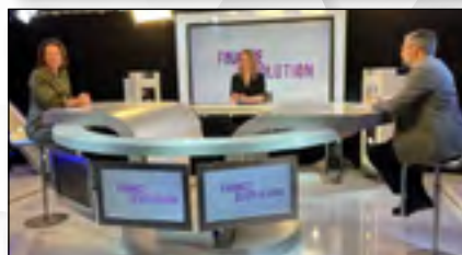
TENU LES 19 ET 20 MAI 2021