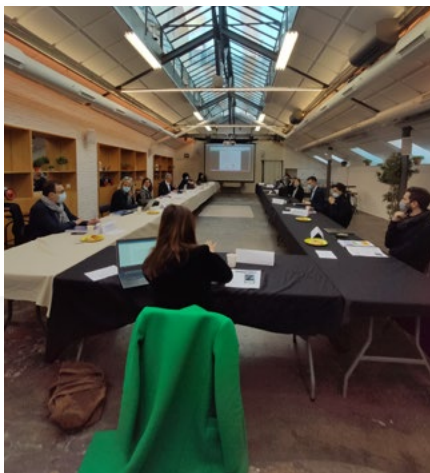
Réunion de délibération du deuxième Jury

RÉDACTRICE EN CHEF DES MARQUES MÉDIAS E-COMMERCE & RELATION CLIENT CHEZ NETMEDIA GROUP